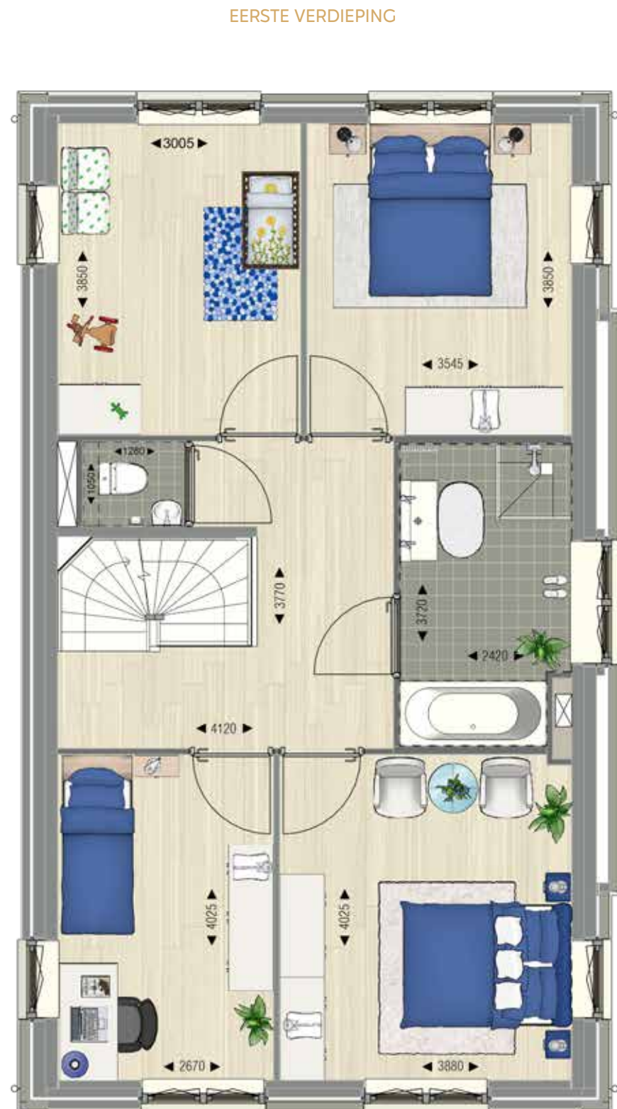
Vrijstaande villa | Bouwnummer 11.

De plattegronden geven een indruk van de indeling van de woning. Hierin kunnen opties zijn verwerkt.