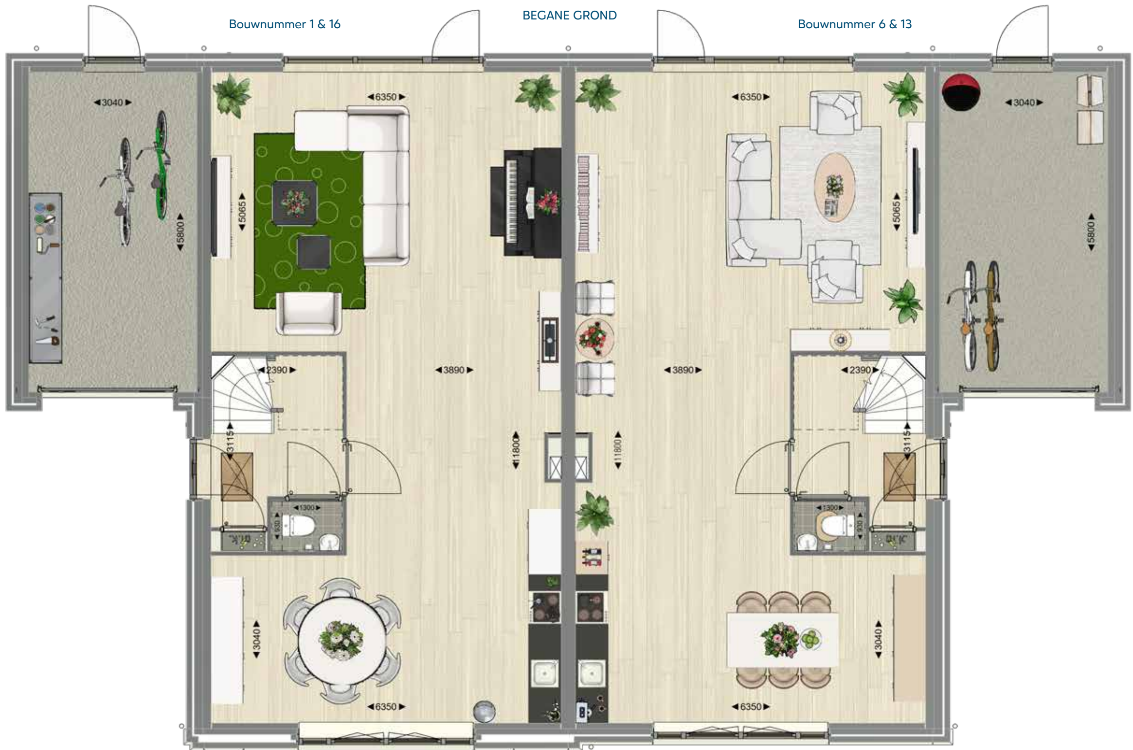
Geschakelde villa met tuitgevel

De plattegronden geven een indruk van de indeling van de woning. Hierin kunnen opties zijn verwerkt.